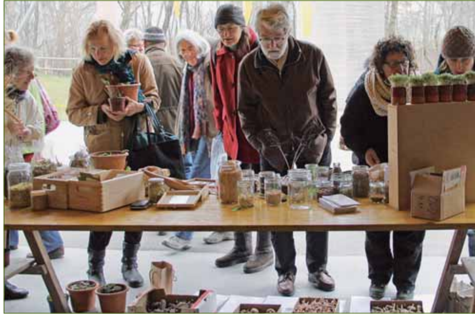
In den Thurauen: Die Samen in Gläsern, Töpfen, Tüten und Schachteln wecken grosses Interesse

Die Workshops stiessen auf grosses Interesse. Viele Fragen wurden gestellt: über die europäische Saatgutgesetzgebung, Patentvergaben auf Leben, zu Neuigkeiten auf dem Gebiet der Gentechnik, der Verdrängung alter- und Landsorten, zu «urbain gardening» und Vertragslandwirtschaft sowie zur Situation in den osteuropäischen Ländern. Trotz der Fülle an Informationen, wie skrupellos die Saatgutkonzerne mithilfe uninformierter, lebensfremder und beeinflussbarer Bürokraten ihre Interessen in nationalen und internationalen Institutionen umzusetzen versuchen, war die Stim-