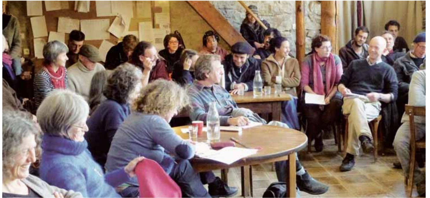
April 2013: Mehrere Generationen aus allen Kooperativen treffen sich zur gemeinsamen Besprechung in Longo maï bei Limans in der Provence