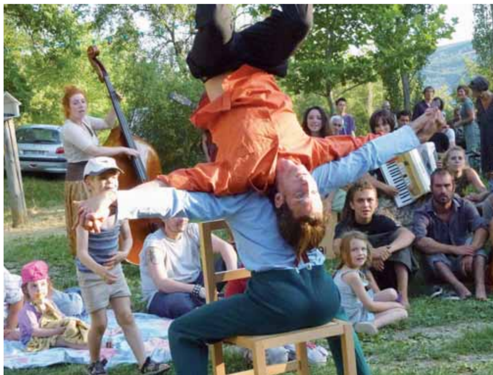
Akrobatik beim Amphitheater in der Provence: Wer steht hier kopf? Longo maï oder die Welt?

Wir haben das vierte Jahrzehnt erreicht und freuen uns, dies feiern zu können. Es soll kein andächtiges Jubiläum werden, denn das Erlebte bleibt in den Erinnerungen. Feiern, sich austauschen, hören und sehen, sich Gedanken machen über den heutigen Lauf der Welt; auf diese Art und Weise möchten wir die 40 Jahre individueller und kollektiver Entfaltung und Revolten feiern. Natürlich auch, um Kraft und Energie für die kommenden 40 Jahre zu tanken; was angesichts der aktuellen Weltlage unentbehrlich ist.