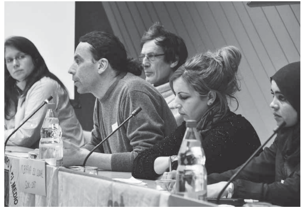
Mit einem SOC-Vertreter berichten Arbeiterinnen über ihre schwierige Lage.

Vom 3. bis 10. Februar weilte eine Delegation der andalusischen LandarbeiterInnen-Gewerkschaft SOC in der Schweiz. An Informationsabenden in Genf und in Zürich sowie einem Bäuerinnen-Treffen in Kirchliedach bei Bern informierte die Delegation über die prekären Arbeitsbedingungen in der Produktion und Verarbeitung von Früchten und Gemüse im Plastikmeer Almerias. Höhepunkt der Tournee war am 7. Februar die Tagung in Bern