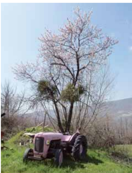
Provence: Sogar der Traktor spürt den Frühling