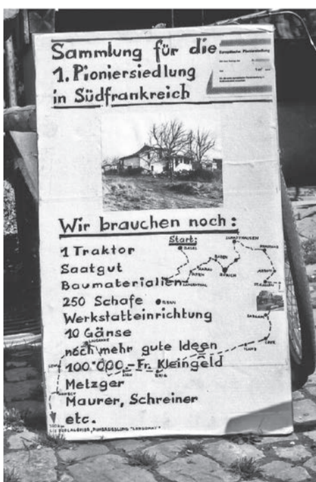
Der erste Wunschzettel von Longo maï