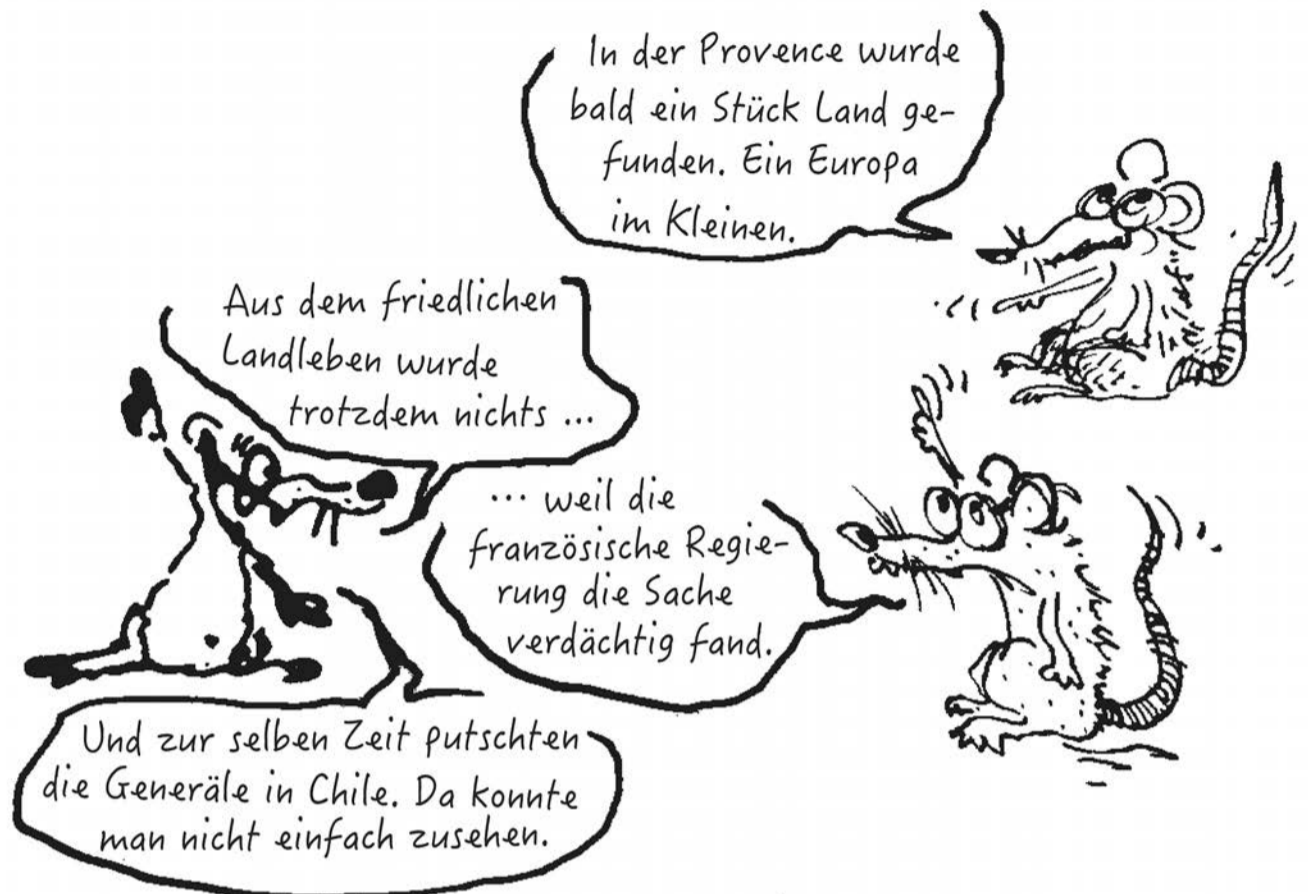
Illustration: Walter Lack, Atelier Populaire International, Drava Verlag A.P.I. Klagenfurt 2014

* Walter Lack, (1955–2006) u.a. Zeichner, Illustrator, Layouter, Drucker, Mechaniker, Lastwagen-, Mährescher- und Baggerfahrer, Baufachmann lebte in den Longo maï-Kooperativen in Frankreich, der Schweiz, Österreich und Deutschland.