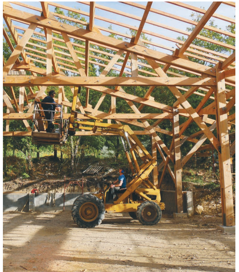
Endlich bekommen auch die Landmaschinen ein zünftiges Winterquartier.

Die Provence ist bekannt für ihre Sonne und Trockenheit, doch die Hitzewellen haben auch Schattenseiten. Dank der neu angelegten Staubecken, welche Obst- und Gemüsegärten mit Wasser versorgen, konnten wir unseren Trinkwasserhaushalt enorm reduzieren, doch die Reserven bleiben beschränkt. Daher braucht es eine gute Koordination, um mit dem kostbaren Giesswasser bestens haushalten zu können. Vor einigen Jahren wollten viele der jüngeren Generation die Organisationsform für die Gartenaktivitäten umgestalten, nun teilen sich ungefähr zwanzig Leute diese sowie die Verantwortung für zehn Gemüsegärten. So können junge Menschen, die erst vor Kurzem zu uns gestossen sind, für einen Teilbereich sehr viel schneller Verantwortlichkeit übernehmen; dazu gehören auch die notwendige Vor- und Nachbereitung, Düngen mit Mist oder Brennesseljauche, Anlage und Unterhalt des Komposts, Installation von Zäunen gegen die Wildschweine, Winterfestmachung der Giessvorrichtungen und vieles mehr. Einige von ihnen fasziniert vor allem die Erhaltung des eigenen Saatguts: Junge Pflänzchen selbst ziehen, hegen und pflegen zu können, quasi vom Samenkorn bis auf den Teller; mit eigenen Sojasamen entsteht gar eine kleine