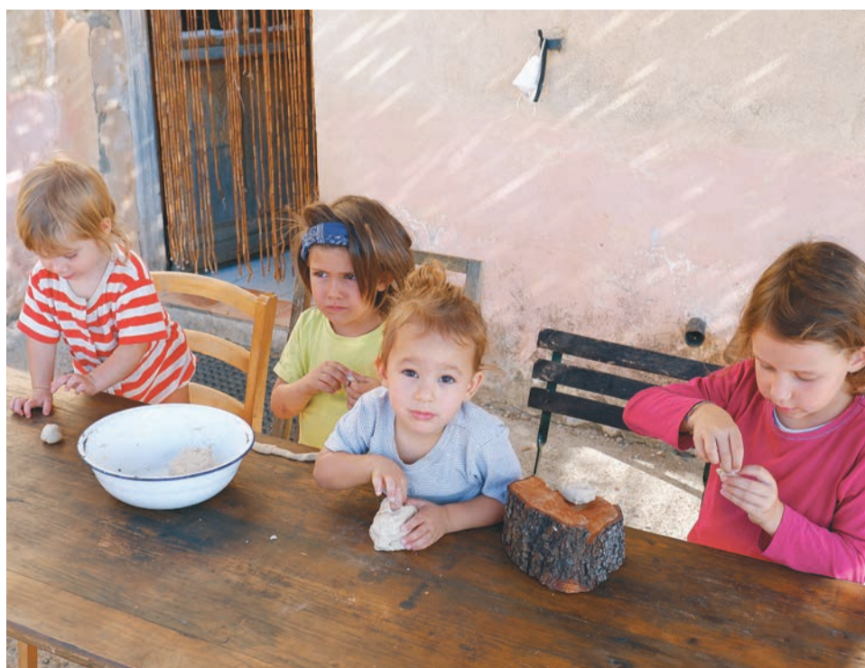
Die vier Kinder vom Weingut La Gabrery haben ihre eigene Art die Welt zu betrachten.

Fort von der Stadt, unmenschlichen Arbeitsbedingungen, nutzlosen Schreibtischjobs oder sinnentleerter Saisonarbeit in der Landwirtschaft. Sie sind hier an diesem Ort geblieben wegen seiner Schönheit und der vielen Möglichkeiten, die er bietet, und wollten sich voll und ganz in das Projekt Longo maï einbringen. Heute leben auch ihre vier Kinder auf dem Hof, der ihnen ermöglicht, an der frischen Luft aufzuwachsen, immer einen Spielplatz vor der Tür zu haben, sich vom Gemüse aus dem eigenen Garten zu ernähren, die Hände in die Erde zu stecken und Vögel zu beobachten. Ein optimistischer Blick in die Zukunft fällt heutzutage mitunter schwer und doch schöpfen wir durch unsere Kinder viel Hoffnung. Die Klimakrise bedroht die Zukunft der Menschheit, bewaffnete Konflikte und Kriege dominieren die täglichen Nachrichten, ein profitorientiertes Wirtschaftssystem zerstört weiterhin Ressourcen und Menschenleben. All das entzieht sich unserer Kontrolle, lässt uns ohnmächtig fühlen. Durch unsere Erfahrungen im kollektiven Leben können wir unseren Kindern viel mitgeben: Emotionale Bindungen